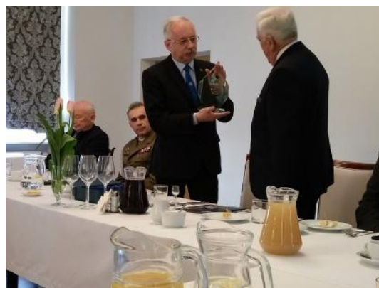
XX lecie Oddziału Warszawa- Rakowiecka