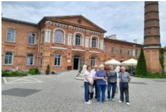
Twierdza Modlin, maj 2023