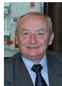
Gen. bryg. Witold Cieślewski

Gen. bryg. Witold Cieślewski podzielił się informacjami o współpracy państw-członków NATO, ze znaczeniem elektroniki na współczesnym polu walki konwencjonalnym i jądrowym. Omówił teoretyczne podstawy walki elektronicznej w obezwładnianiu systemów informatycznych i łączności przeciwnika oraz historię konfliktu izraelsko-palestyńskiego, jego przebieg i skutki wojny Izraela z Hamasem;