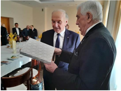
Wielkanoc - 2023