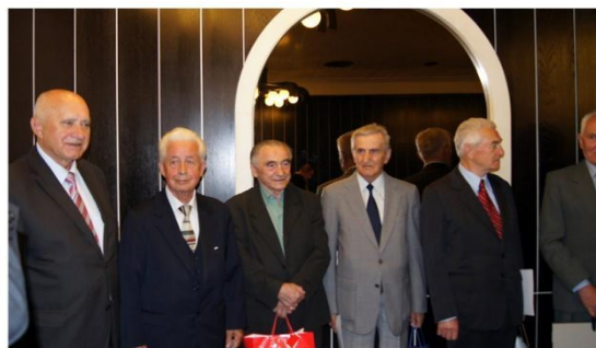
XX lecie Oddziału Warszawa- Rakowiecka