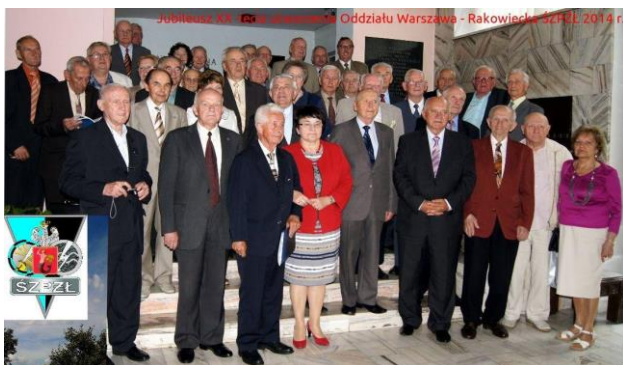
XX lecie Oddziału Warszawa- Rakowiecka