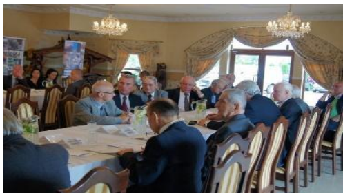
V Walny Zjazd ŚZPŻŁ