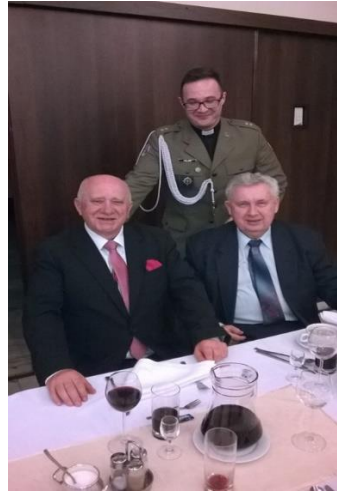
Spotkanie Wielkanocne, 2017