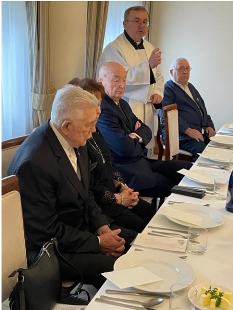
Spotkanie oplatkowe 2023