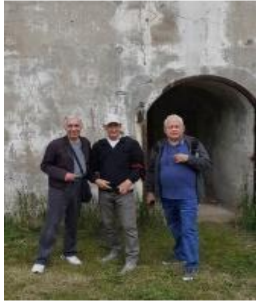
Twierdza Modlin, maj 2023