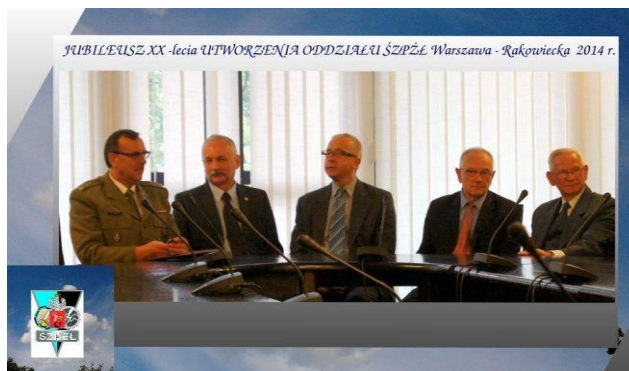
XX lecie Oddziału Warszawa- Rakowiecka