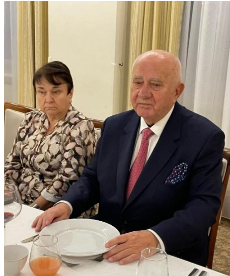
Spotkanie oplatkowe 2023