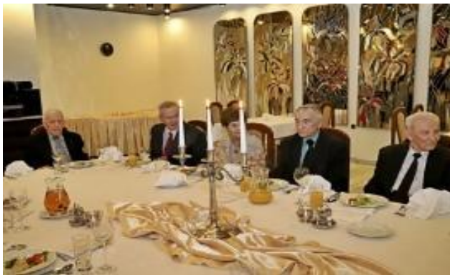
Spotkanie oplatkowe- grudzień 2019