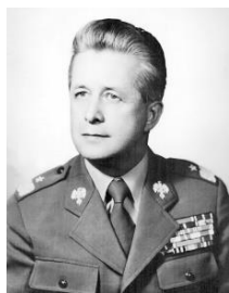
gen. Henryk Andracki

dyskusji w jawnym głosowaniu przyjęto statut Światowego Związku Polskich Żołnierzy Łączności oraz wybrano Władze Naczelne: