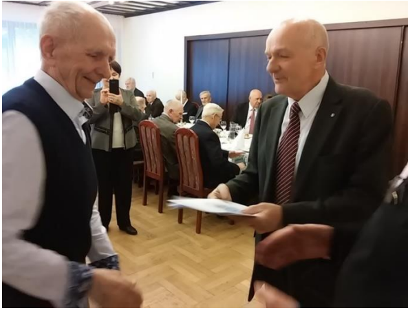
Spotkanie Wielkanocne, 2017