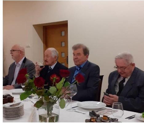
Spotkanie opłatkowe – grudzień 2023