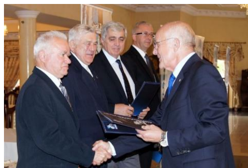
VIII Walny Zjazd ŚZPŻŁ

W czasie Walnych Zjazdów wręczane są najbardziej aktywnym członkom ŚZPŻŁ wyróżnienia, medale i nadawane tytuły Honorowego Członka. Koledzy z Oddziału Warszawa byli wielokrotnie nagradzani i odznaczani: