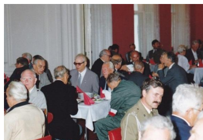
I Walny Zjazd Światowego Związku Polskich Żołnierzy Łączności