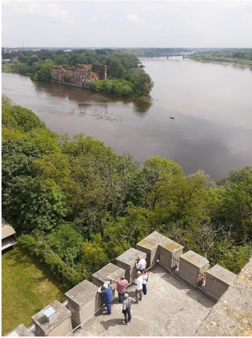
Twierdza Modlin, maj 2023