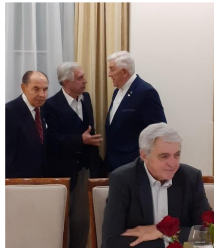
Spotkanie oplatkowe – grudzień 2023