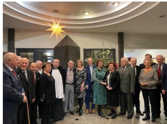
Spotkanie oplatkowe – grudzień 2023